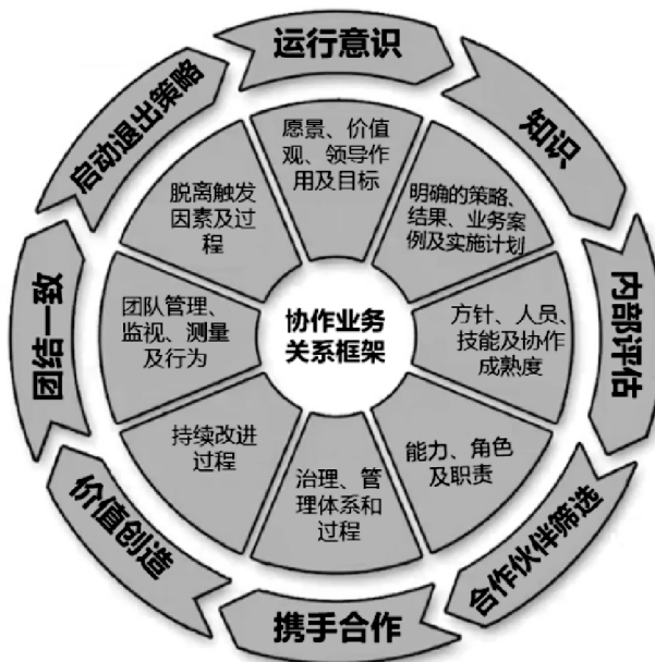
图 2 成功的协作业务关系重要组成部分概览

生命周期框架解决了源自高阶管理体系带来的许多问题,并且会随特定关系的生命周期的环境和成熟度发生变化。这些不断发展的主题影响协作组织的行为和组织文化,以确保它们有效、持续优化,并通过协作方法为相关方带来更大的收益(见图 2)。